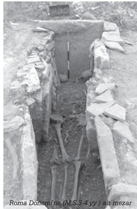
Roma Dönemi'ne (M.S.3-4.yy.) ait mezar

Önde anahtar taşıyan ve arkasında ilahiler söyleyen genç kızlardan oluşan koro, törenler esnasında kutsal yoldan Lagina Hekate Kutsal Alanı'na doğru yürüdükünde, etrafta bulunan yerleşimlerden insanlar gelip bu kızların arkalarından yürüyerek birlikte ilerliyorlardı. Kutsal alana varıncaya kadar yol kenarındaki yerleşmelerden olan katılım ile kalabalık sürekli artıyordu. Genç kız korusu ve halk kutsal alana girdikten sonra törenler başlıyordu. Bu nedenle kutsal yol, kenarında bulunan