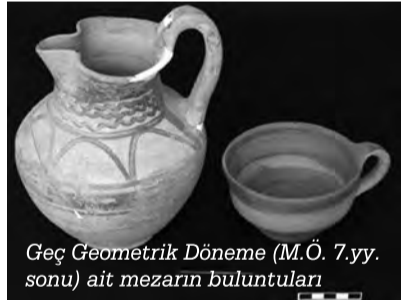
Geç Geometrik Döneme (M.Ö. 7.yy. sonu) ait mezarın buluntuları