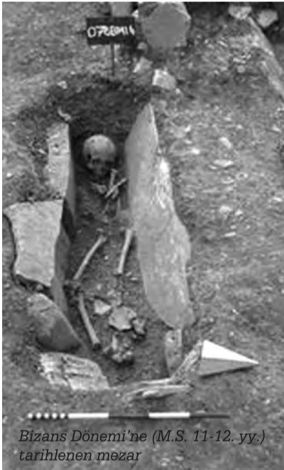
Bizans Dönemi'ne (M.S. 11-12. yy.) tarihlenen mezar

Çalışmalar sayesinde siyasi merkez ile dini merkez arasındaki kutsal yol düzenlemesi ve bu yolun kenarındaki