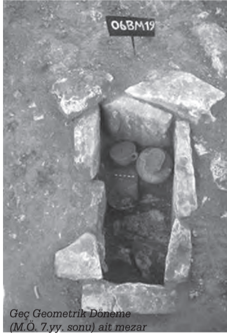
Geç Geometrik Döneme (M.Ö. 7.yy. sonu) ait mezar

Muğla ilinde yerli ve yabancı turistlerin en çok ilgi gösterdiği yerlerden birisi Stratonikeia antik kentidir. Stratonikeia, yaklaşık 3 bin yıllık bir sürece ait tarihi olan ve günümüzde halen daha yaşayan ailelerin olduğu, yaşayan bir arkeoloji köyüdür.