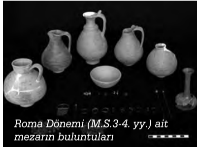
Roma Dönemi (M.S.3-4. yy.) ait mezarın buluntuları

kazı yapılmamıştı. Proje kapsamında bu kutsal yol kenarında bulunan mezarların araştırması ve kazısı gerçekleştirildi.