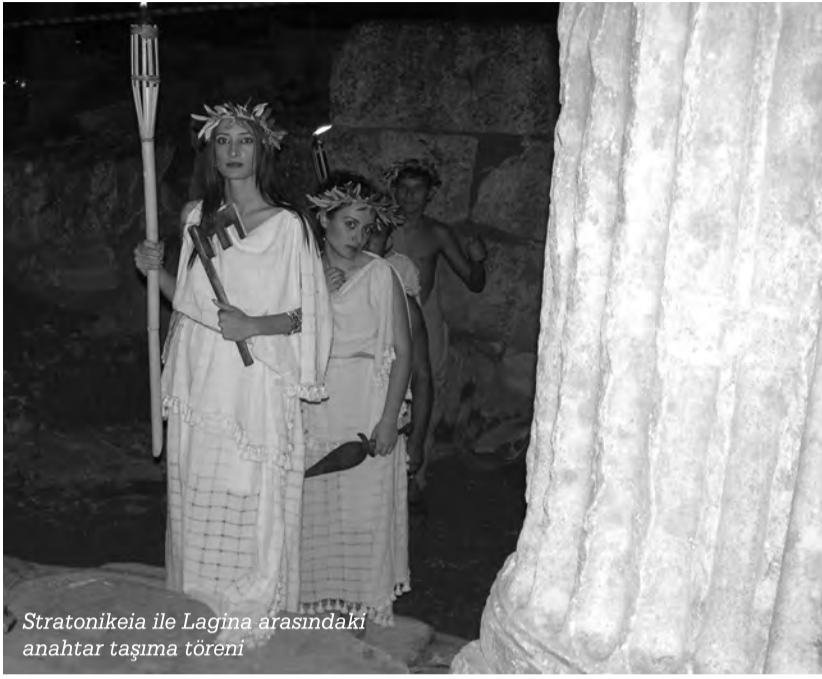
Stratonikeia ile Lagina arasındaki anahtar taşıma töreni

kalıntılar ve yerleşmeler ile burada gerçekleşen törenlerin büyük bir önemi vardı.