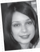
Hacer YANIKARA Fizyoterapi 2. Sınıf